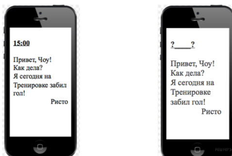
Рисунок 4. Пример задания на этапе мотивации

Ристо отправил Чоу электронное сообщение в 15:00 по местному времени.