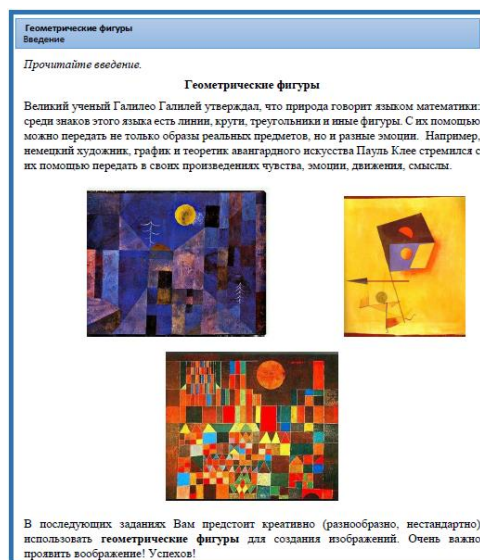
Рисунок 2. Образец задания, требующего использования художественных средств — словесных и изобразительных